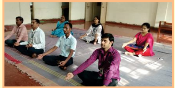
जागतिक योग दिवस प्रसंगी योग करताना बँकेचे कर्मचारी.