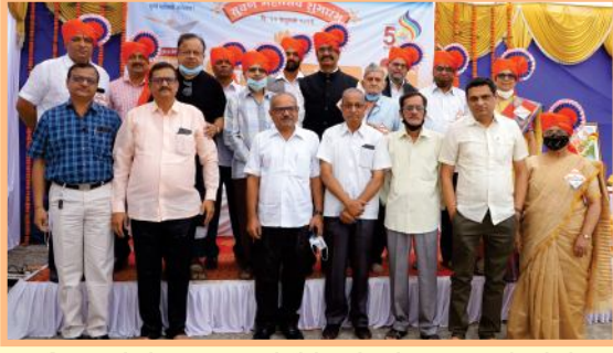
बँकेच्या सुवर्ण महोत्सव शुभारंभ प्रसंगी बँकेचे आजी माजी संचालक व माजी कर्मचारी.