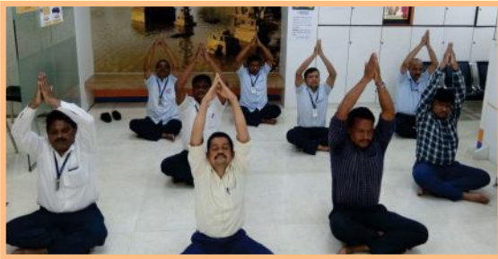
जागतिक योग दिवस प्रसंगी योग करताना बँकेचे कर्मचारी.